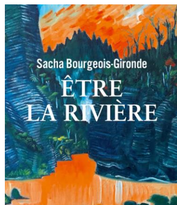
Table ronde Comment dépasser la vision de l'eau comme ressource ?